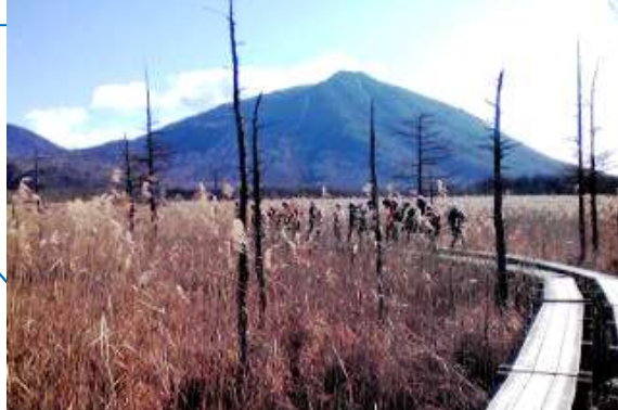
・男体山を見て歩く戦場ヶ原