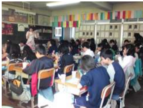
10/30 新型インフルエンザまん延の中欠席0での5年歯みがき指導

さて、今年もあとわずかになりました。私は、年末になると自分自身の「自分の十大ニュース」を書きとめるようにしてから、もう10年近くになります。毎年のことですが、最初の5、6個はすぐに思い浮かびますが、その後はなかなか出てこないでいつも考え込んでしまいます。1年間の出来事ですが、一人の人間の出来事として10個が出てこないことはちょっとさびしい気持ちになります。でも、今年は曾谷小に赴任してきたおかげで、たくさんの出来事があり、多くのすばらしい人たちと出会い、いろいろな思い出ができました。どうやら今年は考え込まないですみそうです。みなさんにとって、この1年はどうだったのでしょうか?