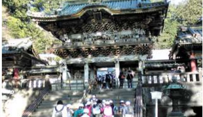
11/27・28 6年日光修学旅行・東照宮陽明門