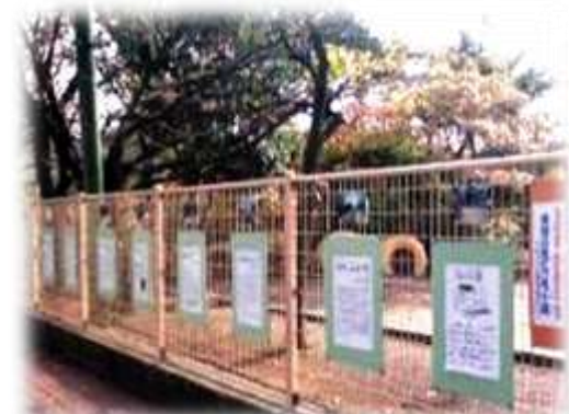
紅葉の曾谷山の前のフェンスに取り付けられた「曾谷の見どころ十選」